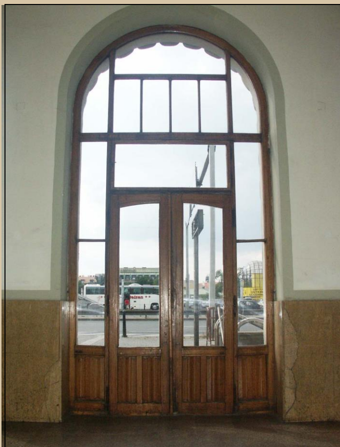
vnitřní líc dvevního křídla