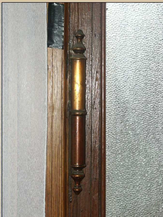
původní dvevní závěs na většině dvevních křídél