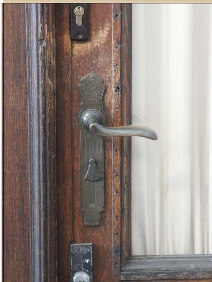
původní kování dochované na některých dveřích