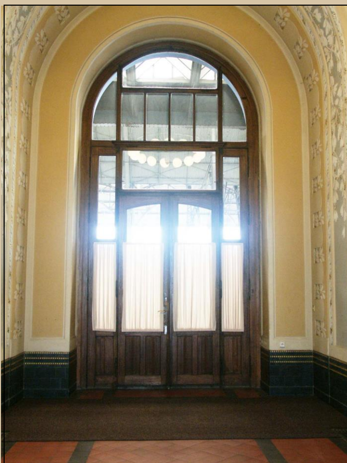
pohled z interiéru